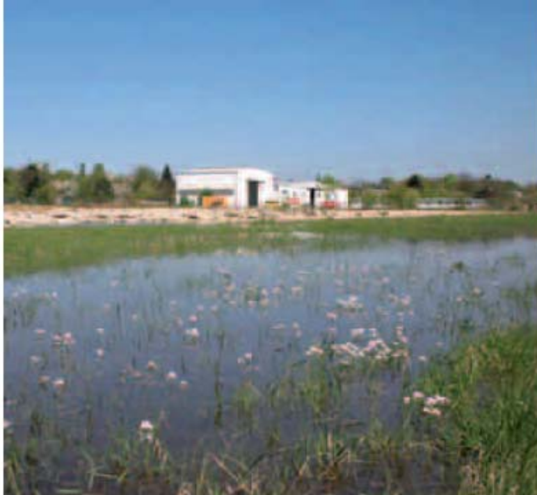
▲ Abb. 3 Lebensraum der Wechselkröte, hier überschwemmte Brachflächen und Wiesengebiete.

Die Männchen machen im Frühjahr durch ihre leise trillernden Balzrufe im Gewässer auf sich aufmerksam. Bei der kleinsten Störung stellen sie ihre Rufe ein und tauchen unter. Maulwurfgrillen ( Gryllotalpa gryllotalpa ), die ebenfalls an Gewässerufern vorkommen, haben einen sehr ähnlichen Ruf. Die Laichschnüre werden im schnell durch die Sonne erwärmten Wasser abgelegt. Von allen einheimischen Krötenarten hat die Wechselkröte die meisten (bis über 15 000) und auch die kleinsten Eier in ihren 3-4 m langen Laichschnüren. Bei Wassertemperaturen von über 25 °C schlüpfen die ersten Kaulquappen bereits nach 50-70 Stunden. Die weitere Entwicklung bis zum Verlassen des Gewässers kann unter günstigen Bedingungen bereits nach sechs Wochen abgeschlossen sein. Dann sind die kleinen Wechselkröten etwa 1-1,5 cm groß. Sie halten sich