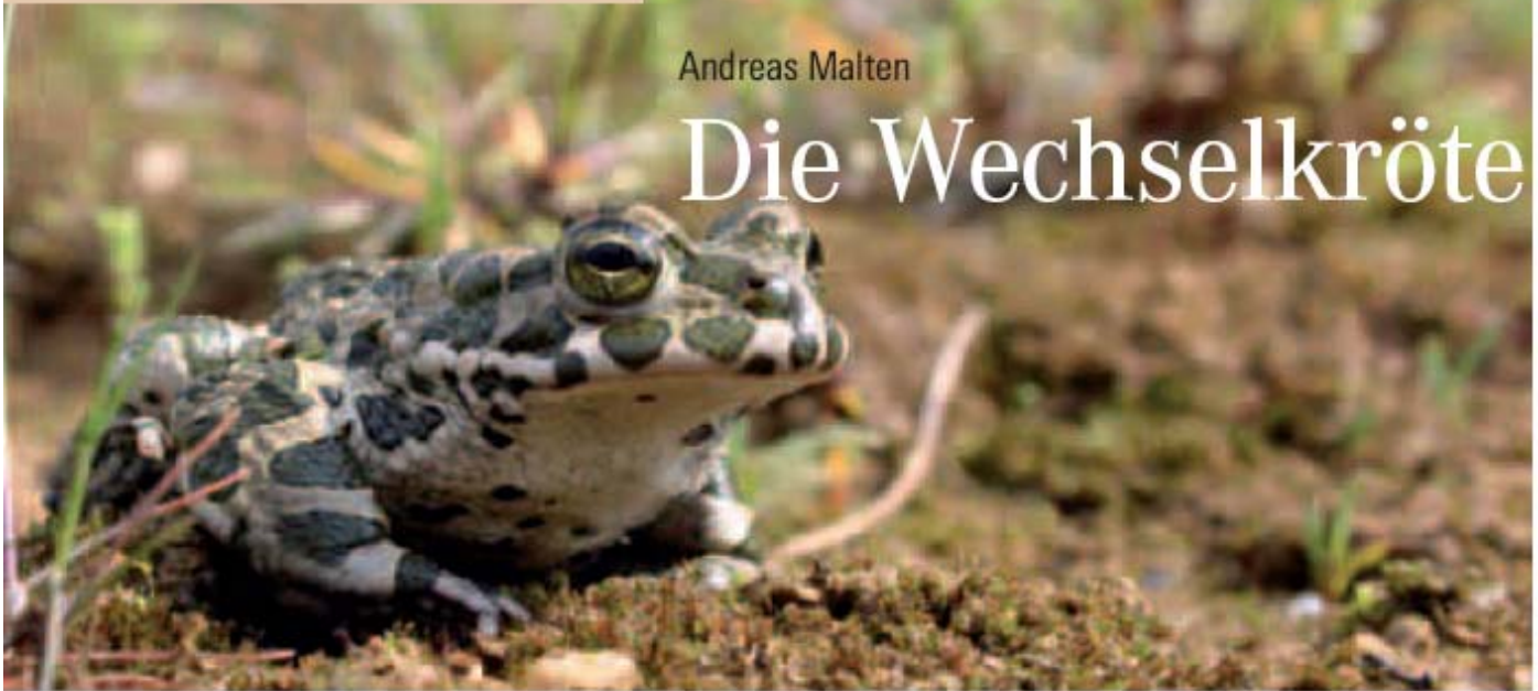
▲ Abb. 1 Wechselkröte mit charakteristischer Zeichnung.

Die Wechselkröte Bufo viridis gehört wie die Erdkröte ( Bufo bufo ) – die durch ihre oft in großer Zahl stattfindenden alljährlichen Wanderungen zu ihren Laichgewässern vielen bekannt ist – zur Familie der echten Kröten (Bufonidae). Weltweit sind aus dieser Familie etwa 340 Arten beschrieben, von denen drei (die dritte ist die Kreuzkröte Bufo calamita ) bei uns vorkommen.