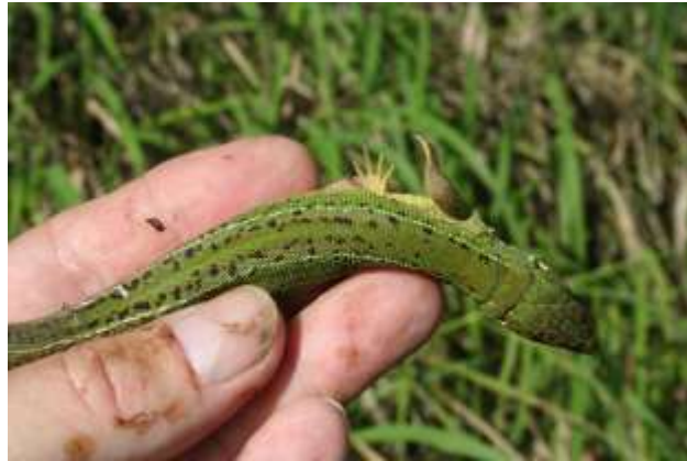
Abb. 1: Junges Smaragdeidechsen-Weibchen. Erster gesicherter Nachweis vom Rotweinberg bei Runkel.

de. Des Weiteren ist die Population dauerhaft von Pflegemaßnahmen abhängig. Bei langfristigem Ausbleiben solcher Maßnahmen wird der Lebensraum für die Smaragdeidechse aufgrund der fortschreitenden Sukzession dauerhaft verloren gehen und die Population letztendlich aussterben. Auch eine größere Feuersbrunst kann möglicherweise schon zum Auslöschen der Population führen!