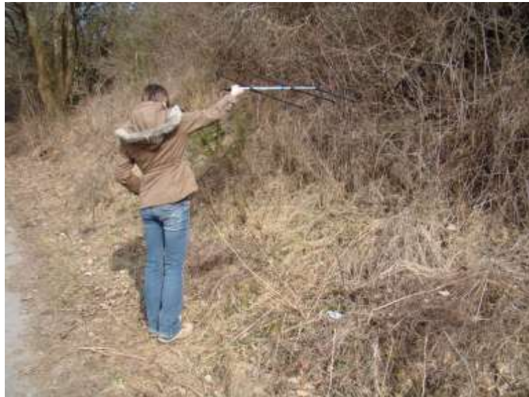
Abb. 2: Identifizierung des Überwinterungsortes einer Äskulapnatter bei Bärstadt.

Im Rahmen der Kooperation mit der Uni Würzburg wird die Telemetrie im Jahr 2011 fortgesetzt. Die Ergebnisse der auf fünf Jahre konzipierten Studie gehen direkt in die Überarbeitung unserer bisherigen Schutzmaßnahmen ein und sollen zukünftig den Schutz der Überwinterungshabitate und Wanderkorridore mit einbeziehen.